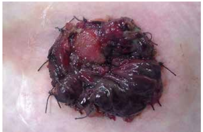
Foto 1. Het afsterven van het stomaslijmvlies als gevolg van een verminderde doorbloeding

Mevrouw wordt opgenomen op 20 juni met een gastroparese en een paralytische ileus bij een stenoserende recidiverende diverticulitis, waarvoor op 1 juli een low anterior resectie is uitgevoerd. Vanwege morbide obesitas, pulmonale beperking, matige conditie qua fysieke activiteit en matige voedingstoestand is ervoor gekozen om een naad te maken, omdat een stoma aanleggen te risicovol is (1). Het herstel wordt na vier dagen gecompliceerd door een naadlekkage waarvoor ontkoppeling van de anastomose en het aanleggen van een colostoma (figuur 1) noodzakelijk is. Omdat de buikwand niet te sluiten is (door obesitas en naadlekkage), wordt gebruik gemaakt van een