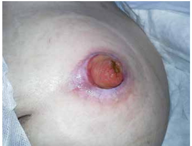
Foto 4. Normaal functionerend stoma

Het herstel van deze mevrouw is zeer gecompliceerd verlopen met een langdurige ziekenhuisopname van twee maanden. Het stoma zag er afschrikwekkend uit waardoor veel zorgverleners zich afvroegen: 'Komt dit ooit goed?'. Het is uiteindelijk allemaal goed gekomen. Ze heeft nu een goed functionerend colostoma en geen klachten van diverticulitis meer.