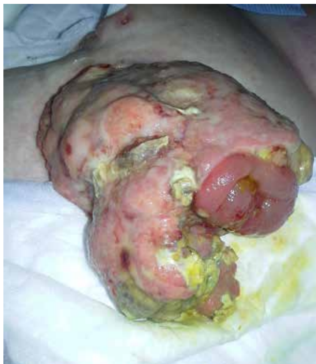
Foto 2. Een week na de operatie