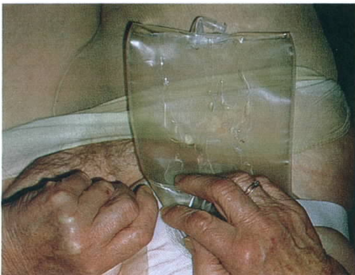
Foto 6. Zonodig een gordeltje aanbrengen. Het gordeltje helpt lichte druk aanbrengen van de plak op de huid, waardoor een betere seal wordt verkregen. Het gordeltje kan na een dag misschien weggelaten worden of helemaal niet worden gebruikt.

Bovenstaande handelingen kunnen natuurlijk ook bij andere systemen gebruikt worden anders dan een convexity.