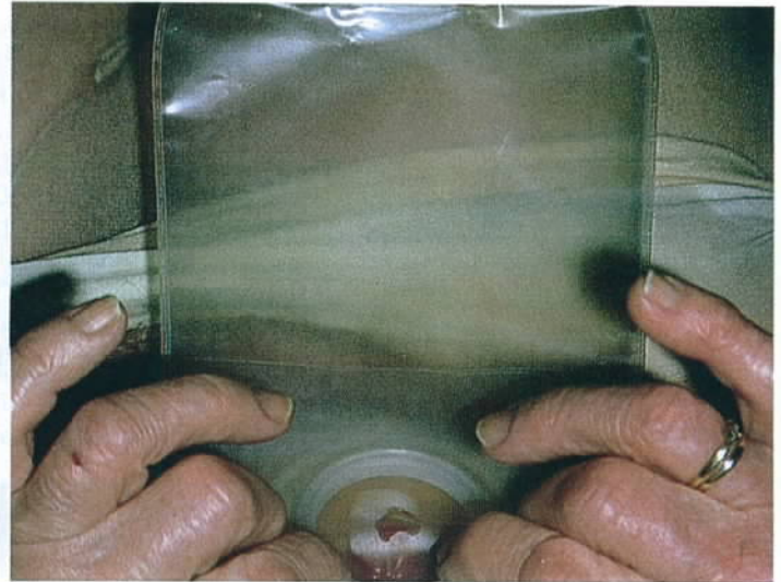
Foto 5. Zakje aanbrengen.