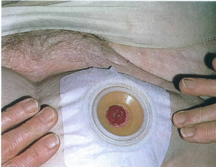
foto 4. Linker hand kan nu los van de buik. Indien nodig de pleister verder vaststrijken over de huid.