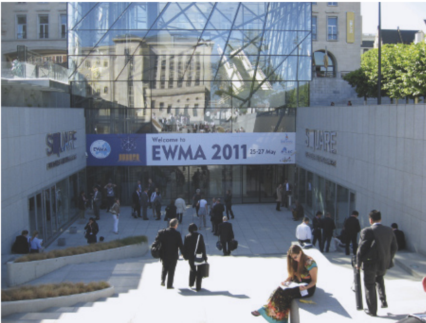
EWMA 2011 Brussel

of kritiek die door de industrie wordt geuit, zal worden beoordeeld door de academische en klinische partners in de organisatie.