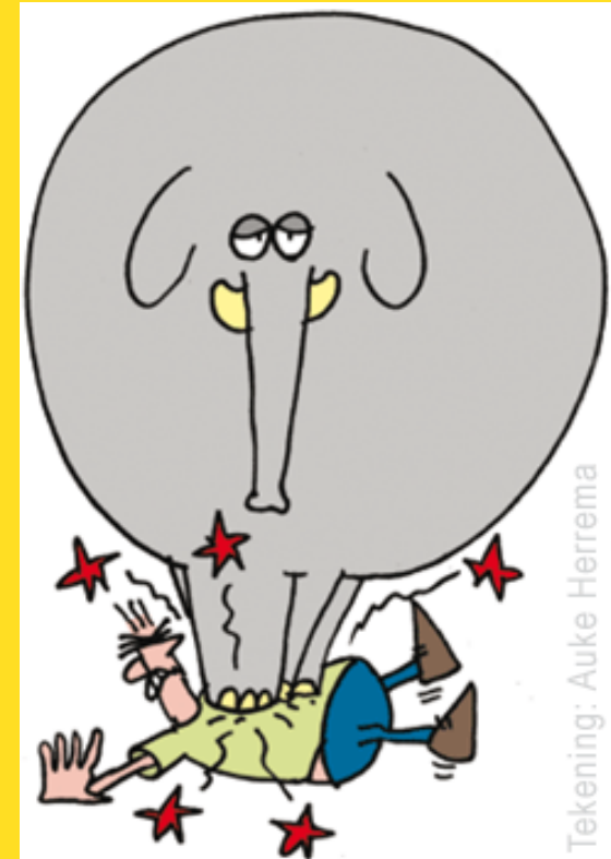
Tekening: Auke Herrema